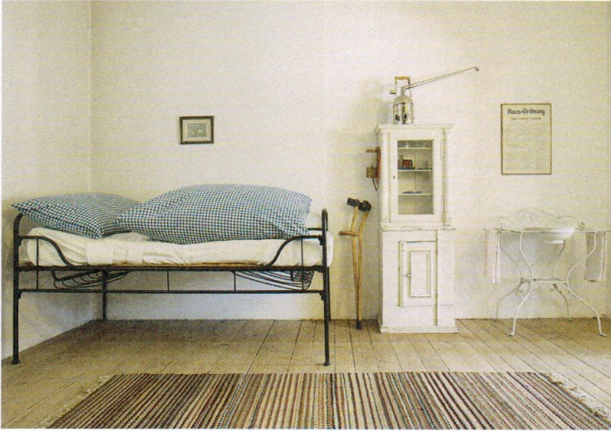
Abb. 6: Das kleine Hausmuseum zeugt nicht nur von den klösterlichen Glanzzeiten, sondern erinnert auch an die Zeit des Klosters als kantonales Kranken- und Greisenasyl, das seit 1868 auch mittellose, nicht mehr arbeitsfähige Knechte und Mägde aufnahm.

rischen Blasbalgs – natürlich nicht fehlen (Abb. 5). Sie ergänzte die von Josepha von Rottenberg angeschafften Instrumente, was ihr die Kritik einbrachte, vor lauter Musik die Wortverkündigung zu vergessen.