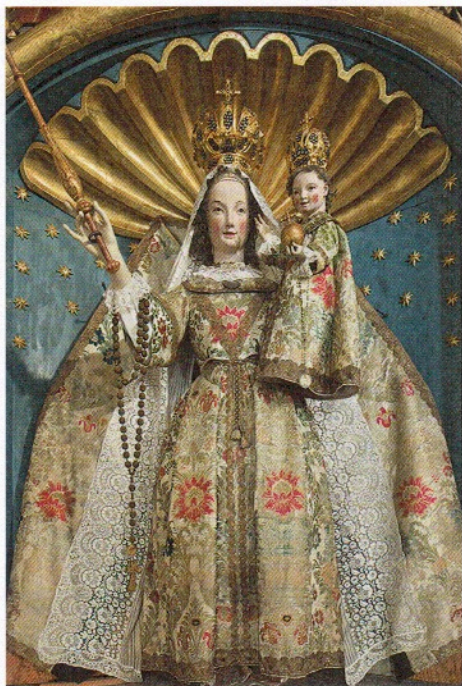
Abb. 3: Mit dem Kloster St. Katharinental sind bedeutende Werke der Plastik um 1300 verbunden. In der Klosterkirche erhalten ist unter anderem die sog. Kreuzlinger Madonna auf dem linken Seitenaltar. Das Werk des Meisters Heinrich von Konstanz wurde 1745 zur barocken Bekleidungsfigur umgearbeitet.

fig in der Mobilität eingeschränkten Patienten eine umfassende Vermittlung der spirituellen Bedeutung, die in der Anlage des Klosters und seinen Kunstschatzen zum Ausdruck kommt.